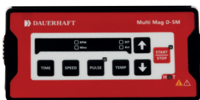
Pantalla e interfaz